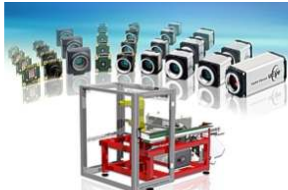
Vor allem im Sondermaschinenbau profitieren Systemintegratoren von einer einfachen, Modell- und Schnittstellen-unabhängigen Kameraintegration.

Ebenso effizient und zuverlässig: Der Einsatz von uEye Kameras bei der Inspektion von Feingussteilen. Bei dieser Prüfanlage von Martin Mechanic prüfen sieben hochauflösende