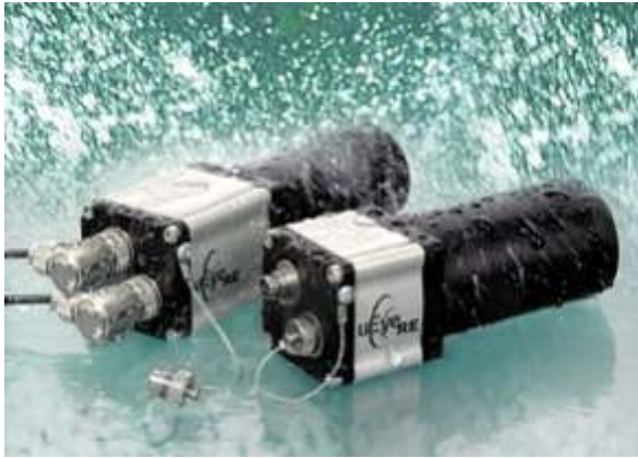
Ein verschraubbarer Objektiv-Tubus und ebenfalls verschraubbare Anschlüsse für den USB-Port und die digitalen Ein-/Ausgänge machen die uEyeRE staubdicht und wassergeschützt