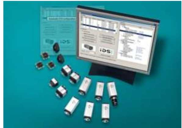
Mit einem für alle Modelle identischen Treiber-Kit gestaltet IDS die Integration seiner Kameras Modell- und Schnittstellen-unabhängig.

Dank umfangreicher Softwareunterstützung ist die Integration der Kamera in die OEM-spezifische Applikation schnell und ohne aufwendiges Engineering möglich. Die Treiber und das Software Development Kit (SDK) sind im Lieferumfang jeder uEye Kamera enthalten. Das SDK beinhaltet mehr als 20 verschiedene Demo-Programme für die Kameraeinbindung und Bilderfassung sowie die zugehörigen Source-Codes in C, C++ und VB. Entwickler können diese schnell in eigene Programme übernehmen und an spezielle Anforderungen anpassen. Bei Kaiser beispielsweise bildet der mitgelieferte Treiber die Basis für eigene Softwarewrapper, um die Kameramodelle flexibel in die intern entwickelten Programme einzubinden. Das SDK unterstützt alle aktuellen Windows-Betriebssysteme einschließlich Vista. Anwender von Standardsoftware erhalten zudem einen TWAIN-Treiber, eine ActiveX-Komponente und einen DirectShow/WDM-Treiber.